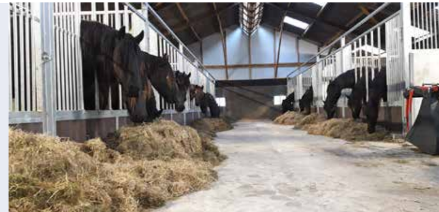
'Door het opfokken krijgen we zelf meer inzicht in de nakomelingen van bepaalde hengsten'