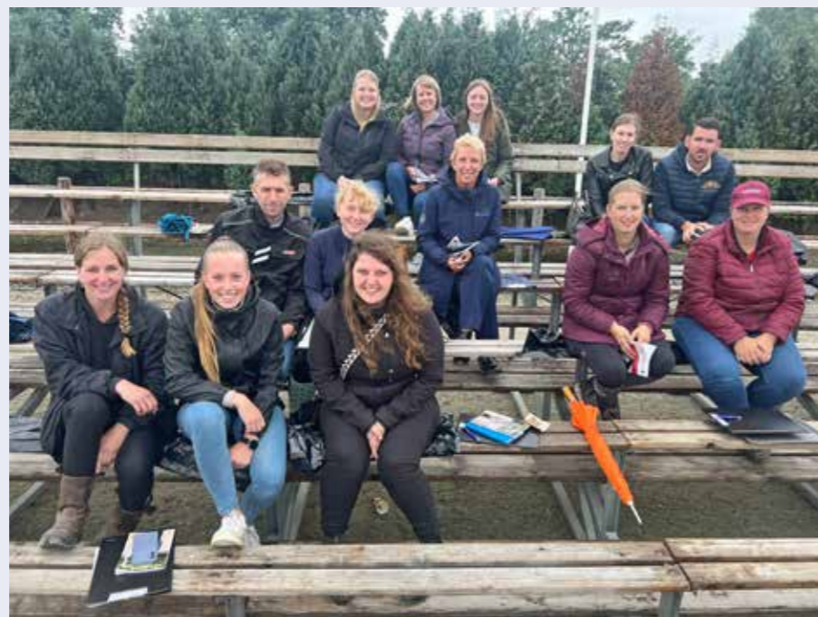
Schaduwjureren op de fokdag in Schijndel.

Ook het schaduwjureren was dit jaar weer een groot succes! Ditmaal waren we op bezoek bij de fokdag in Schijndel waar we hartelijk zijn