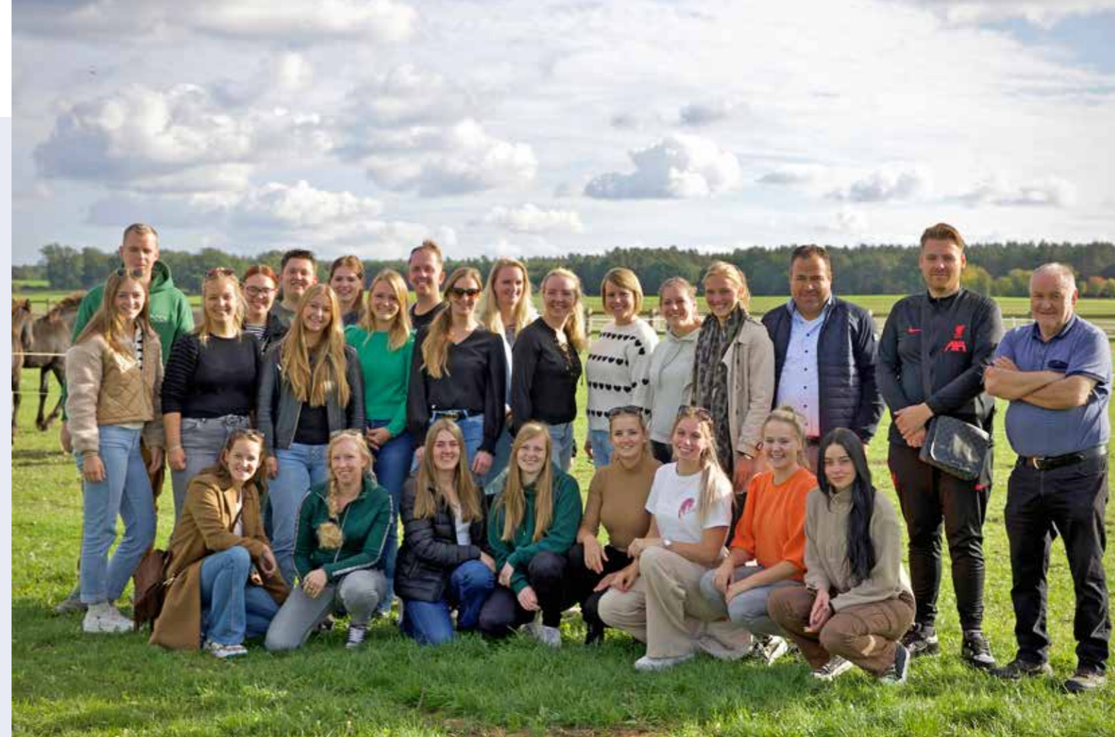
Alle deelnemers aan de buitenlandse reis naar Praag.

Het hoogtepunt van dit jaar was toch wel de buitenlandse reis naar Praag met een leuke groep enthousiaste deelnemers. Tijdens de reis hebben we een bezoek gebracht aan Gestüt