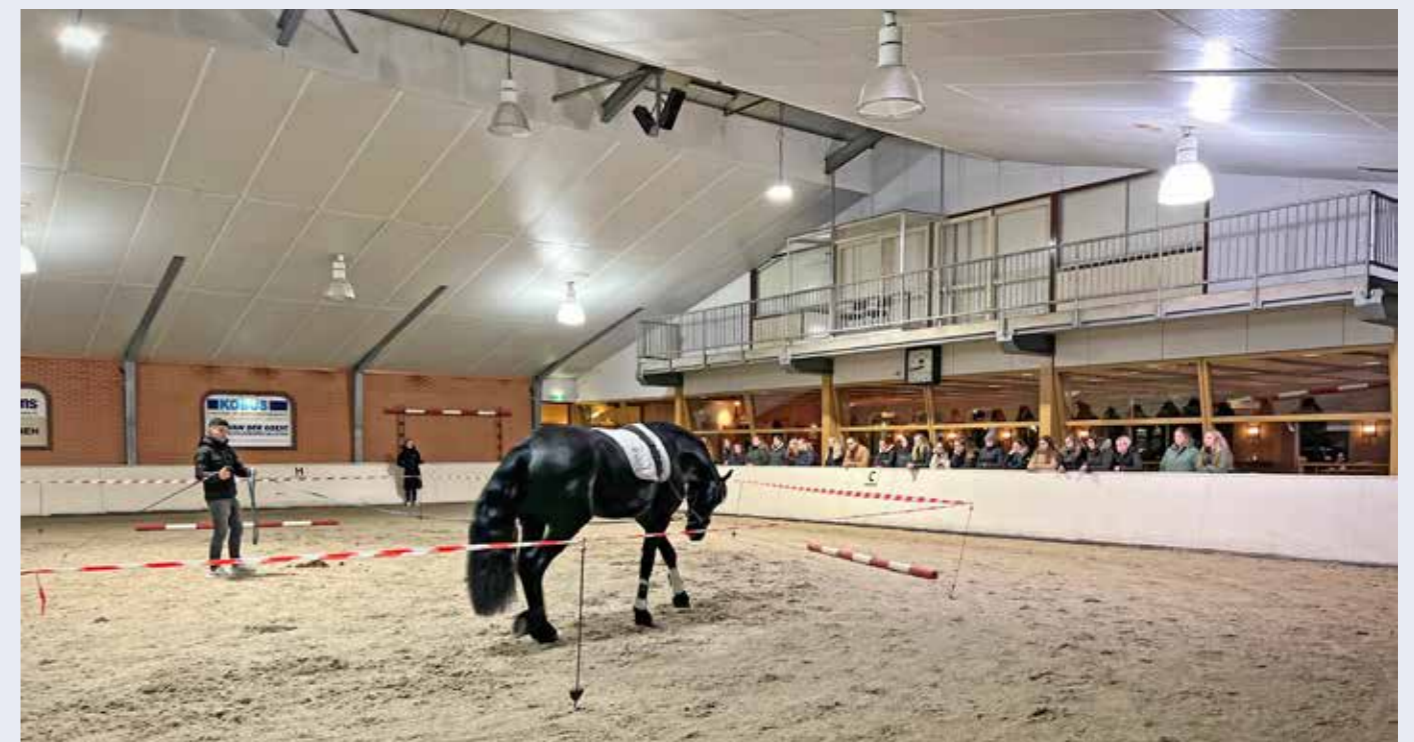
Clinic keuringsklaar maken bij Stal Zwart- Ter Schure.

over het keuringsklaar maken van je paard. Hierbij hebben ze ons uitleg gegeven hoe het keuringsklaar maken in zijn werk gaat en wat je als eigenaar al kunt doen in de voorbereiding.