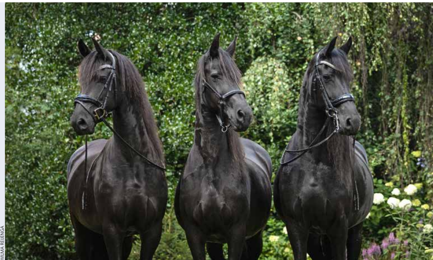
Dyanne Kyra V. Ster AA (Jehannes 484), moeder Kyra Tjarda V. Ster Prestatie (Tsjalke 397) en Lotty Kyra V. Ster Sport A (Uldrik 457)